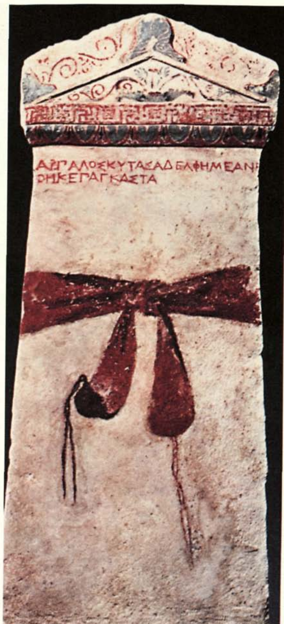
Εικόνα 1Ε. Ἐπιτύμβια στήλη ἀπὸ τῆ Μεγάλῃ Τούμπα τῆς Βεργίνας.