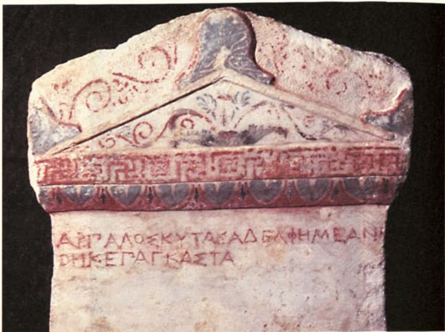
Εικόνα 2Ε. Ἐπιτύμβια στήλη ἀπὸ τῆ Μεγάλῃ Τούμπα τῆς Βεργίνας (λεπτ.).