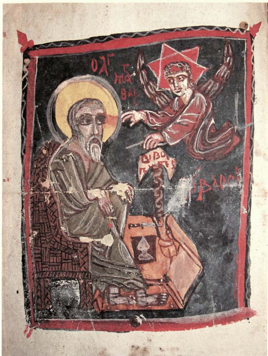
Εικόνα 10Ε. Η μικρογραφία του κώδικα, στο φ. 12ν.