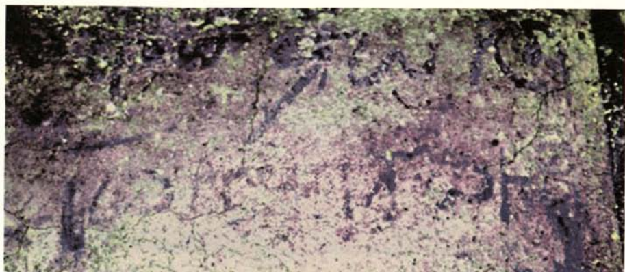
Εικόνα 6Ε. Ἡ ὑπογραφή τοῦ ζωγράφου.