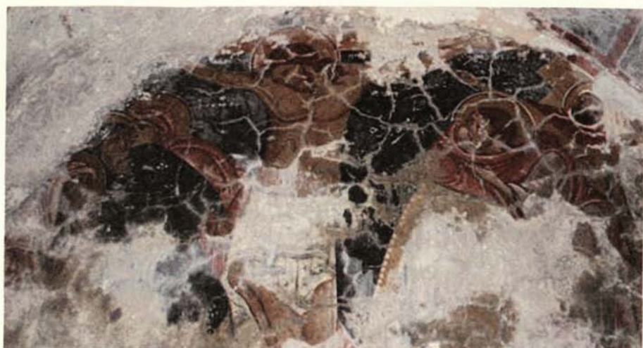
Εικόνα 4Ε. Ἡ Σταύρωση.