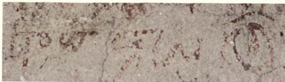
Εικ. 5Ε. Ἡ χρονολογία τῆς ἐπιγραφῆς.