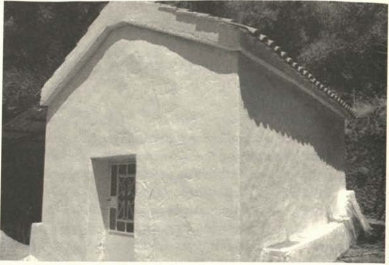
Εικόνα 1. Ὁ Ἅγ. Δημήτριος ἀπὸ ΝΑ.

The style of the paintings and almost every scene or figure are un-Byzantine. Western elements characterise virtually every scene and figure; [...] The conclusion is that the artist has a western training, which he tries to adapt, rather unsuccessfully, to the demands of the Byzantine practice. 6