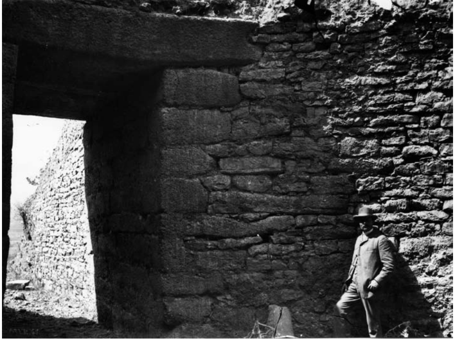
Ο Wilhelm Dörpfeld σε θολωτό τάφο των Μυκηνών (Σεπτέμβριος του 1891).